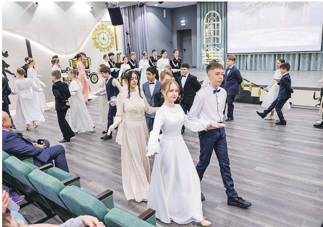
Дети показали зрителям несколько танцев

В Гимназии города Троицка прошёл ежегодный кадетский бал