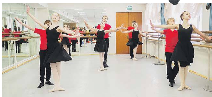
Один из танцевальных номеров Ансамбля