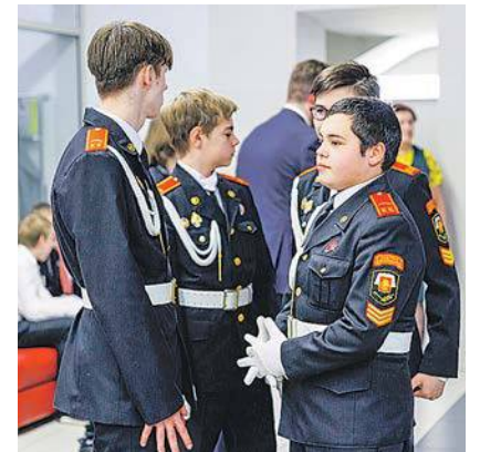
В ожидании бала