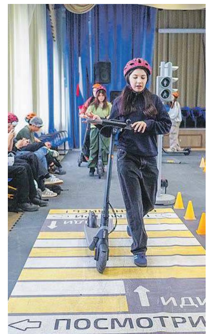
Школьники во время обучения

Проект разработан Городским оператором по профилактике детского дорожно-транспортного травматизма ГБОУДО ЦДЮТ «Бибирево» по инициативе Департамента образования и науки. Средства индивидуальной мобильности предоставил оператор аренды самокатов. Образовательная программа построена по аналогии с обучением в автошколе: сначала школьники проходят инструктаж по правилам дорожного движения для СИМ, затем выполняют практические задания – закрепляют навыки вождения на специально подготовленной трассе. К примеру, можно проехать через лежачие полицейские, пешеходный переход, потренировать упражнения «Змейка», «Восьмёрка». Практика проходит в защитных шлемах и в сопровождении инструктора. «Правила дорожного движения для самокатов вступили в силу 1 марта 2023 года, –