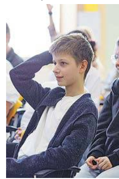
Лицеисты на встрече