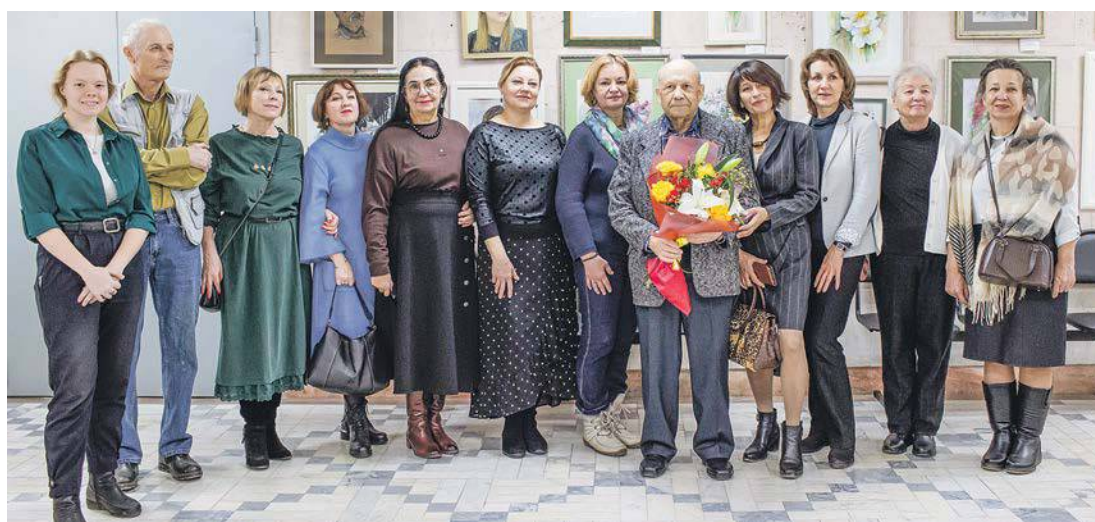
На выставке работ учеников Назарова. Фото с учителем – на память

Наталья МАЙ