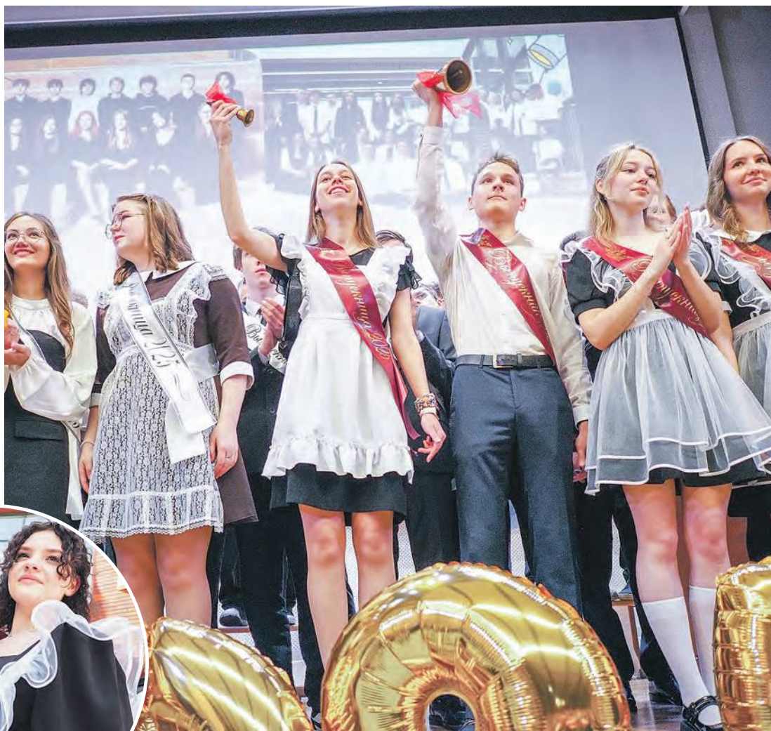
Звучит последний звонок – выпускники прощаются со школой