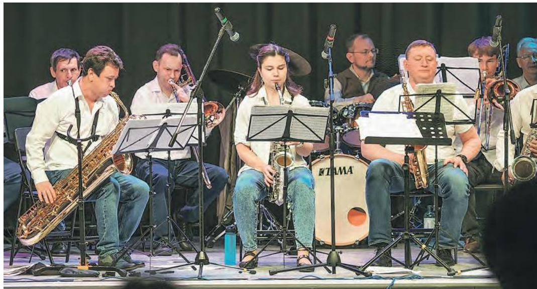
Джазовый оркестр им. Виктора Герасимова выступает на разных площадках Троицка