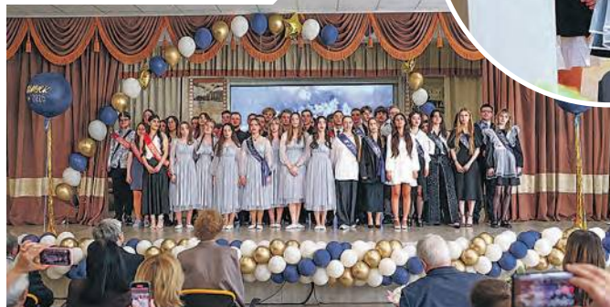
Выпускники Лицея Троицка поздравили своих учителей