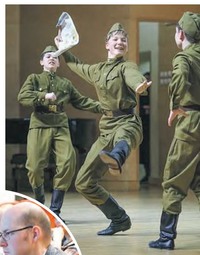
Многие номера были посвящены 80-й годовщине Победы в Великой Отечественной войне