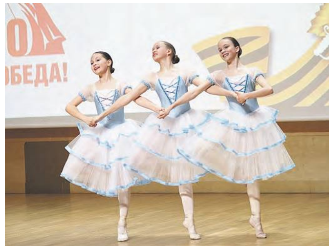
Русский балет – классика на все времена

В Троицк приехали юные музыканты и танцоры из Москвы, Химок, Солнечногорска, Обнинска и Калужской области. Открытый окружной многожанровый конкурс «Отчизны славные напевы» прошёл в ДШИ им. Глинки. Прослушивания и просмотры продолжались два дня, с утра и до вечера, в них приняли участие порядка 400 музыкантов, танцоров и художников