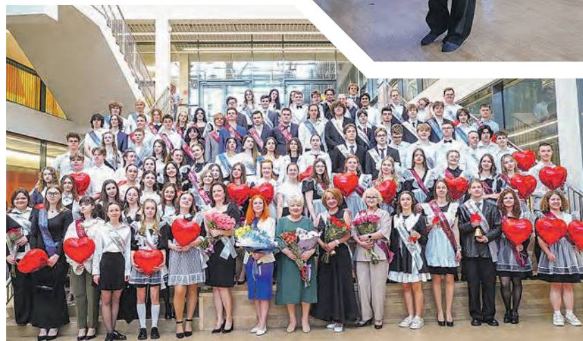
Гимназия им. Н.В. Пушкина – старейшая школа Троицка. В этом году последний звонок прозвенел в новом здании учебного заведения, просторном и современном