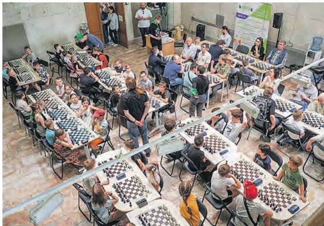
Одновременно за шахматные доски сели несколько десятков участников турнира