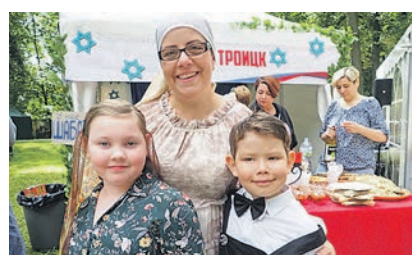
Троицк рассказывал о традициях евреев