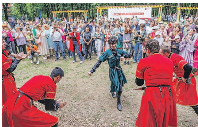
Танцы народов России можно было увидеть на поляне...

и у евреев есть жёсткие правила: не пользоваться новшествами, мобильными телефонами и даже светом, – выходят к микрофону солисты московского мужского еврейского хора. – Поэтому сегодня мы поём для вас а капелла, то есть без музыкального сопровождения. Но... в микрофон! Звучит Нигун – еврейская религиозная песня, которую нередко используют для молитвы и духовного выражения.