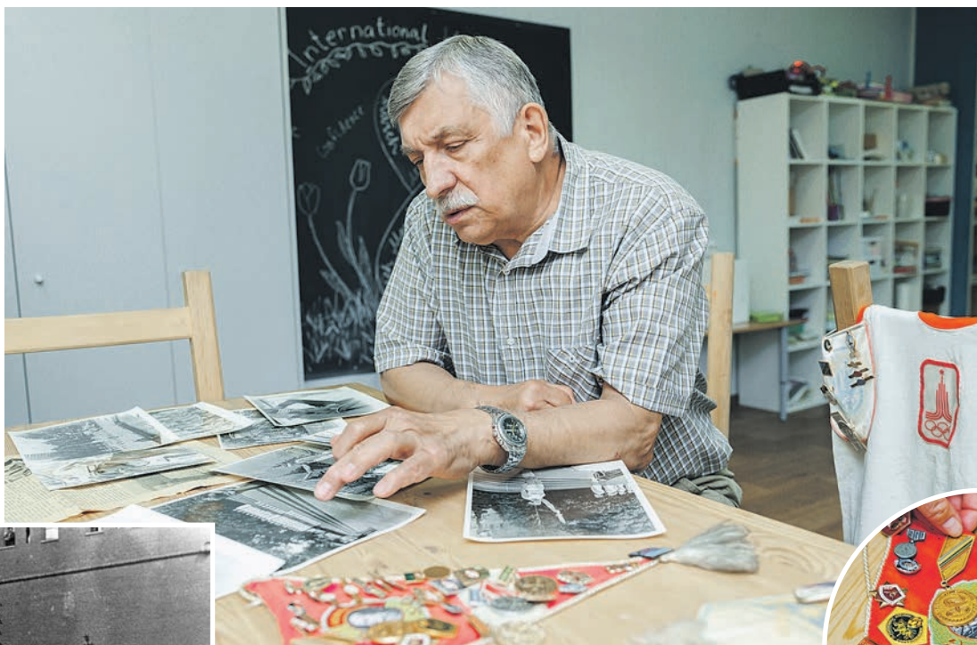
В Советском Союзе на соревнованиях вместо медалей и кубков выдавали значки