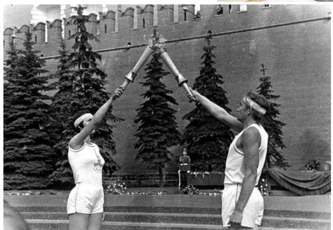
Передача олимпийского огня у стен Кремля