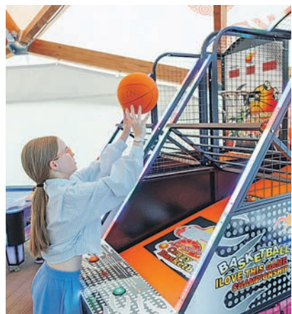
Мини-баскетбол в шатре у дома 2 на улице Нагорной