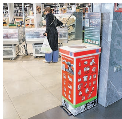
«Корзина добра» на Калужском шоссе, д. 32

«Корзины добра» появились в магазинах района, теперь горожане могут положить в них продукты длительного хранения и хозяйственные товары. Вся собранная помощь отправится на фронт к нашим военным.