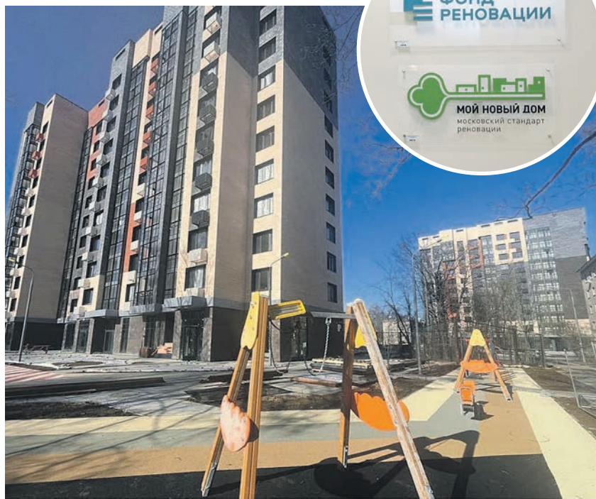
Центр реновации расположен по адресу: Спортивная, д. 3

«Центр станет точкой доступа к необходимой информации и консультациям для жителей домов по адресам: Спортивная, д. 6 и д. 8, Пионерская, д. 7, и Лесная, д. 5. Правительство Москвы и управа райо-