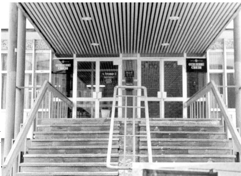
Здание почты на Сиреневом бульваре в советские годы

тивной, 13. «Помню, в последние месяцы в Ватутинках начались проблемы в автобусах. Кондукторы отказывались пропускать почтальонов бесплатно. Говорили: «Советская власть закончилась, удостоверение недействительно».