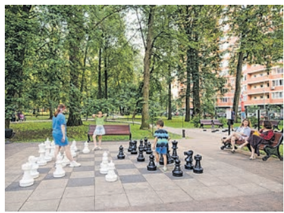
Шахматная доска в парке усадьбы Троицкое