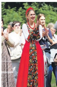
... и на сцене