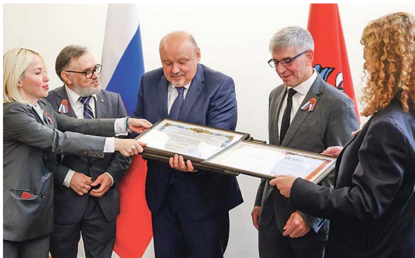
Троицк получил свидетельство о регистрации официальных символов