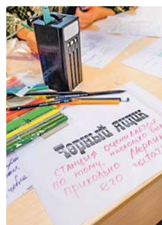
В Лабиринте предстояло решать задачи из самых разных областей