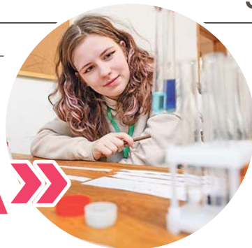
В программе ТМШ – не только теория, но и практика