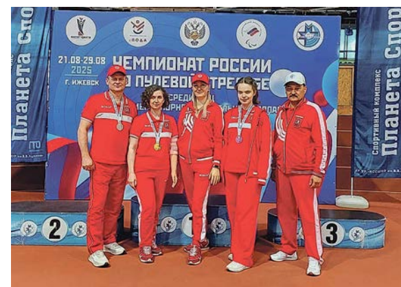
Спортсмены из Троицка

Шоу-программа группы «Параскева» собрала у сцены малышей всех возрастов