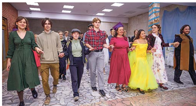
Среди участников бала и сказочные принцессы, и сотрудники НИИ времён Советского Союза