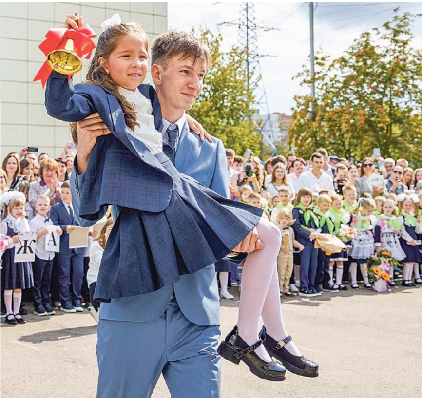
Первый звонок зовёт вчерашних дошколят в классы