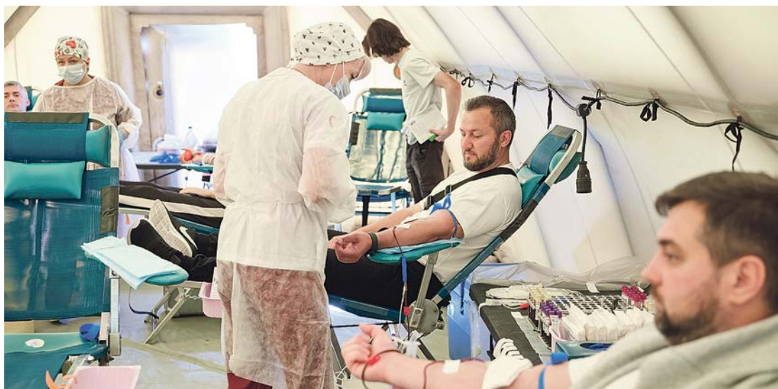
В передвижном донорском зале