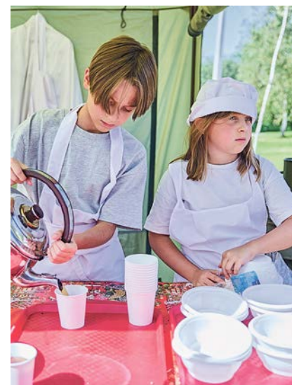
Участников акции угощали гречневой кашей и чаем