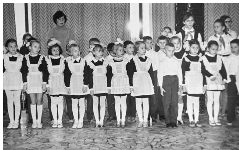
В октябрята детей принимали в холле школы