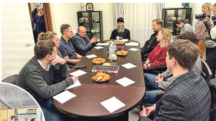
Встреча прошла в доме причта Троицкого храма