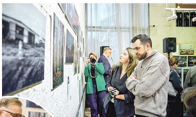
Вернисаж посетили друзья и знакомые авторов фоторабот

ших фотографиях. Мы, фотографы, в каком-то смысле – хранители истории».