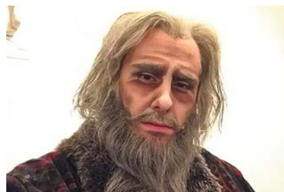
Певец в роли графа Максимилиана в «Разбойниках» Верди, Италия