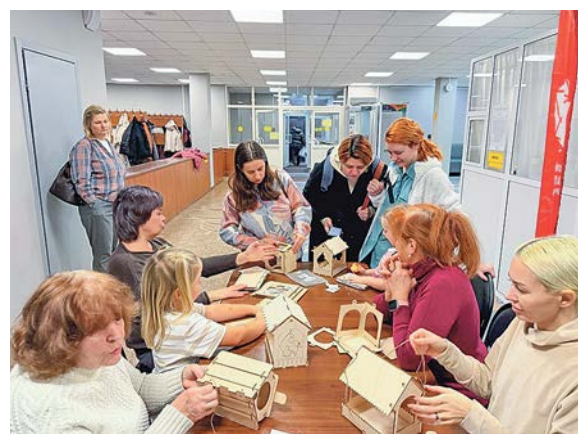
Участники мастер-класса изготовили больше десятка кормушек

Молодёжная палата района организовала ежегодную акцию помощи городским птицам в зимний период. В этом году парламентарии также провели мастер-класс по изготовлению кормушек для пернатых.