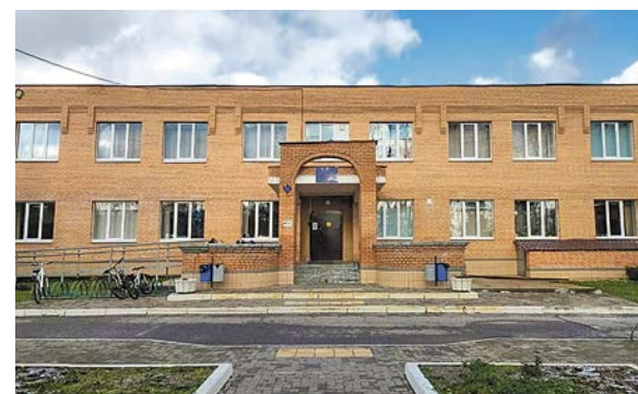
Здание школы в деревне Яковлево

лет – ОБЖ, как на предыдущем месте работы. Сейчас, по прошествии почти 20 лет, я опять вернулась в начальные классы и хочу сказать, что за последние годы дети очень изменились. Стали другими: они больше интересуются гаджетами, нежели окружающим миром. Надеюсь, в будущем мы сможем переломить эту зависимость от смартфонов и вновь увлечём их чем-то другим».