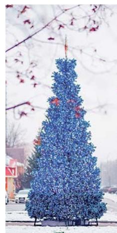
В Троицке установили 14 наряженных ёлок

Полина ХАНДИНА ■ фото Александра КОРНЕЕВА