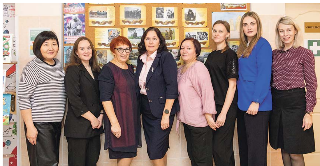
Учителя третьего отделения школы №1392 им. Д. В. Рябинкина

30-летний юбилей отметило третье отделение школы №1392 имени Д. В. Рябинкина в деревне Яковлево – одно из старейших в комплексе. Многие учителя трудятся здесь с момента открытия. О том, как и чем живёт школа все эти годы, – в материале «Городского ритма».