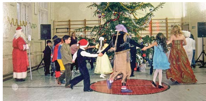
Новый год в школе отмечают шумно и весело

В классах – интерактивные доски с проектором. «Мы демонстрируем детям видеуроки из МЭШ (Московская электронная школа – прим. ред.), это хорошее подспорье, – говорит Лариса Сергеевна. – Кстати, наши учителя были одними из первых, кто получил грант на создание при-