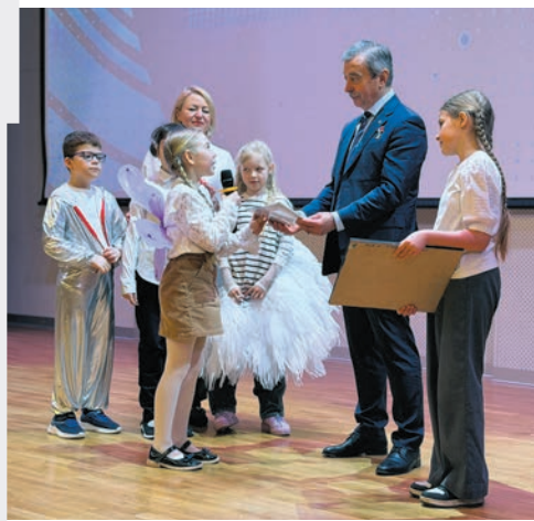
Пушковцы вручили Александру Лазуткину памятные подарки