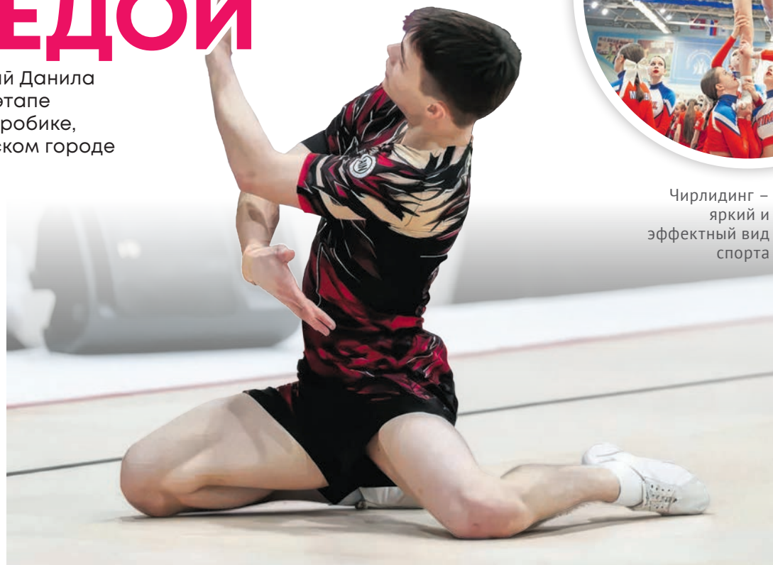
Чирлидинг – яркий и эффектный вид спорта