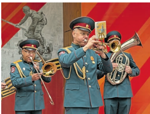
В парке у памятника «Журавли» выступил духовой оркестр МЧС России с ретро-программой военных лет