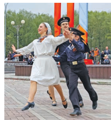
На площади Сиреневого бульвара состоялся концерт с участием творческих коллективов Троицка