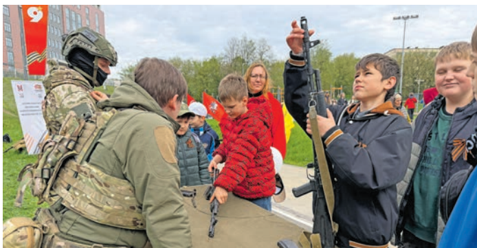
В спортивном парке работали интерактивные площадки: гости увидели выставку оружия, формы и снаряжения времён Великой Отечественной войны