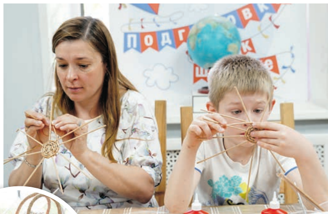
Взрослые увлечены не меньше детей