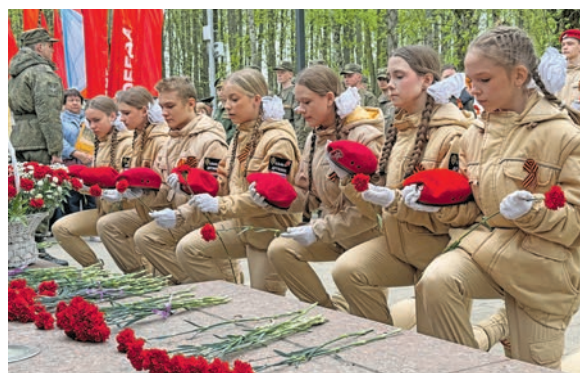
Юнармейцы школы № 1392 им. Дмитрия Рябинкина возложили цветы к монументу