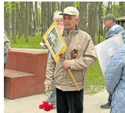
Жители Троицка пришли почтить память павших в бою