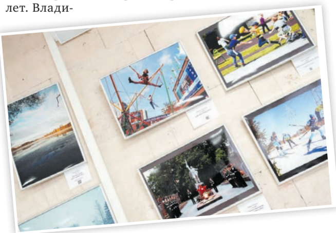
На выставке – Троицк в разные годы