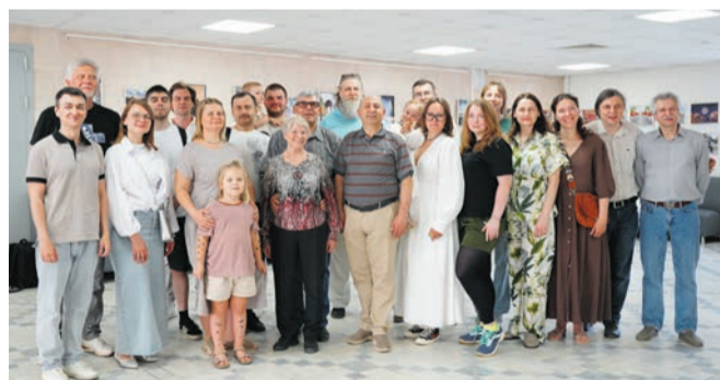
А вот и сами фотографы. Их лица обычно остаются за кадром