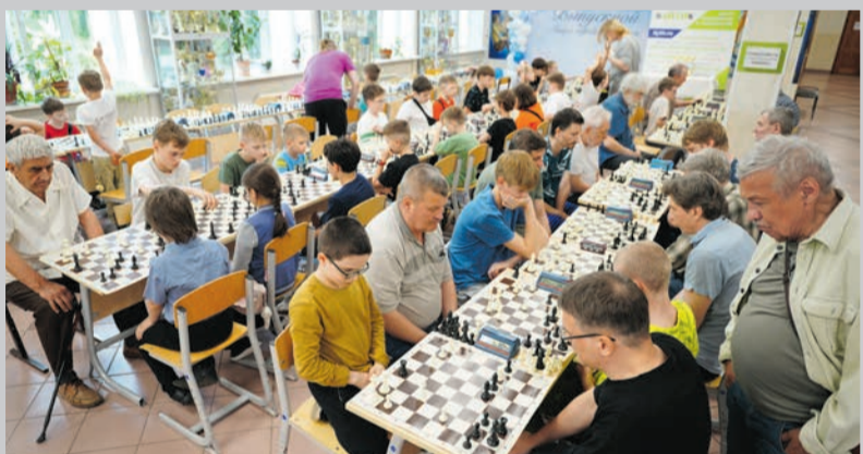
Победителям турнира – кубки и медали

Шахматы объединяют: за доской встречаются соперники любых возрастов